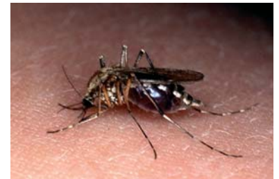
Stechmücken sind die Überträger von Dirofilaria immitis und D. repens

Hochendemiegebiete liegen in Norditalien (Poebene und Toskana) und auf den Kanarischen Inseln La Palma und Teneriffa. In der Poebene besteht mit 95% die weltweit höchste Prävalenz, auf den Inseln sind 32% bzw. 61% der Hunde infiziert.